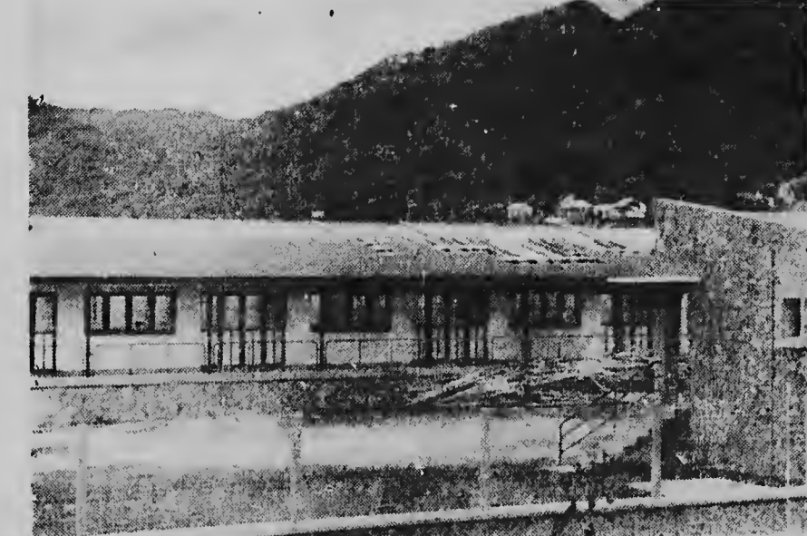
Dz nog niet in gebruik genomen nieuwe school in Marigot, werd eveneens beschadigd, waarvan dakplaten en balken werden afgebruikt.